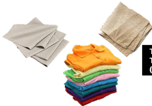
TISSUS, TEXTILES (SAUF NEUF)